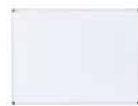
e. Pizarra Blanca