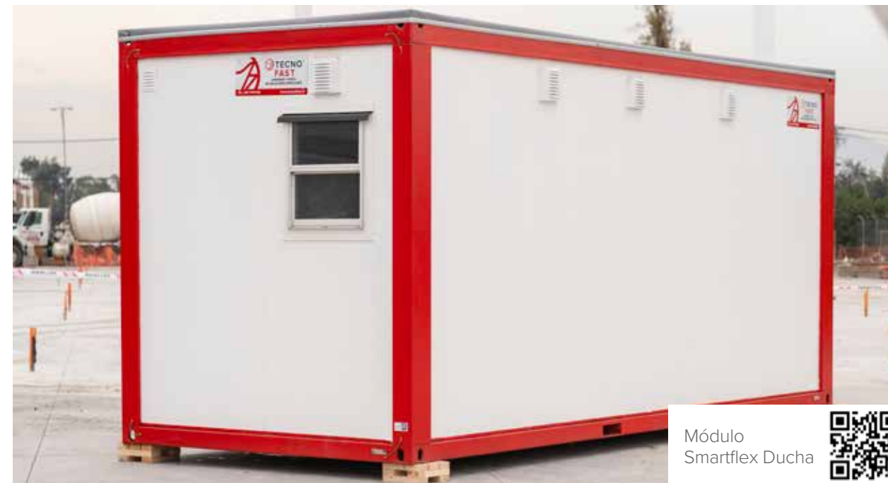
Módulo Smartflex Ducha