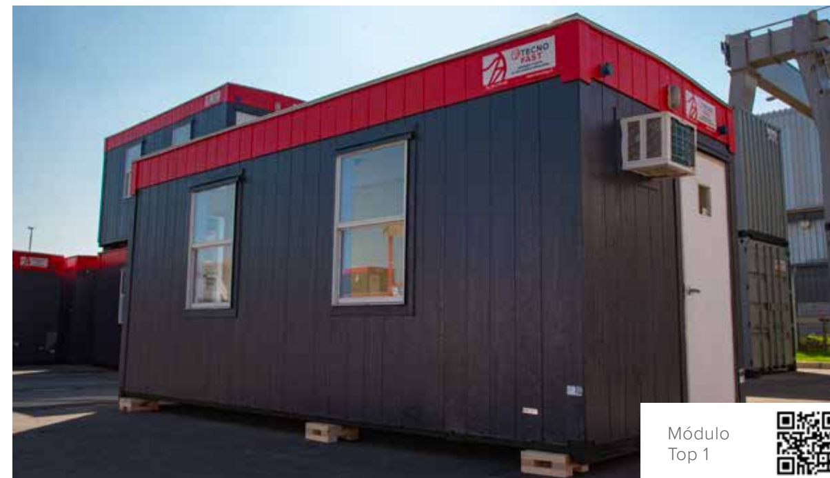
Módulo Top 1