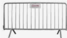
Baranda Tipo B

Blanca 80 x 120 cm Ambas marco aluminio, con plumón y borrador.