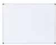
e. Pizarra Blanca