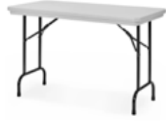
Mesa Básica Jr

244 x 76 cm. Altura 75 cm. Estructura metálica termoesmaltada, cubierta polipropileno espumado de alto impacto.