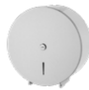
c. Porta rollo