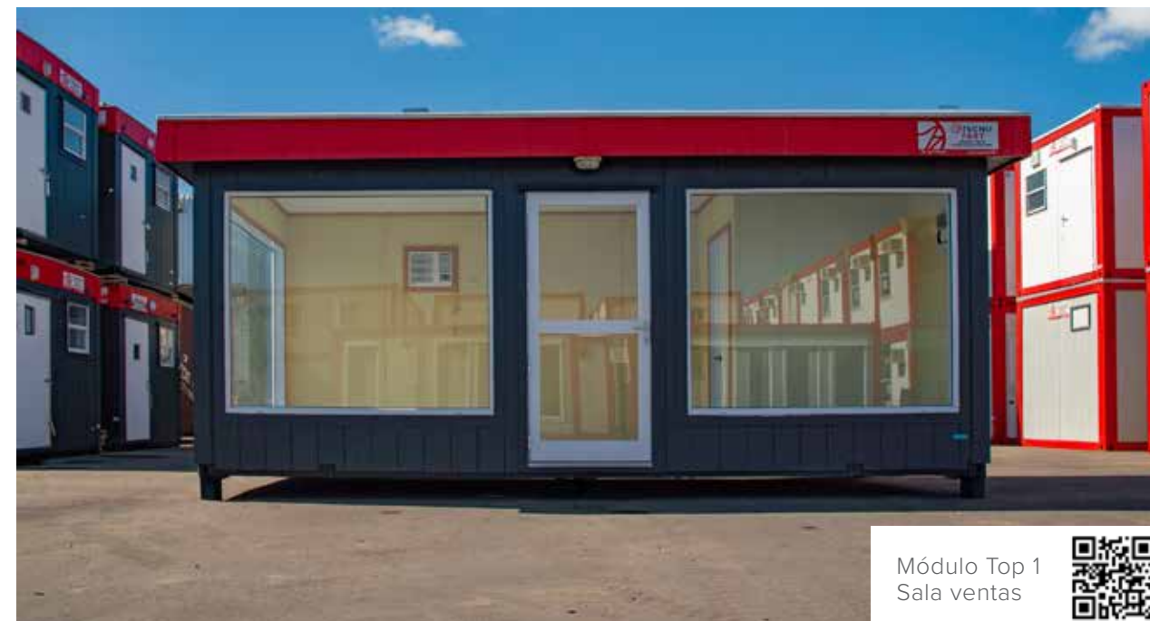
Módulo Top 1 Sala ventas