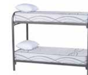
Camarote 1 Plaza