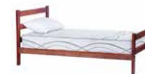
Cama 1 Plaza