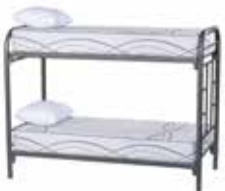
d. Camarote 1 Plaza