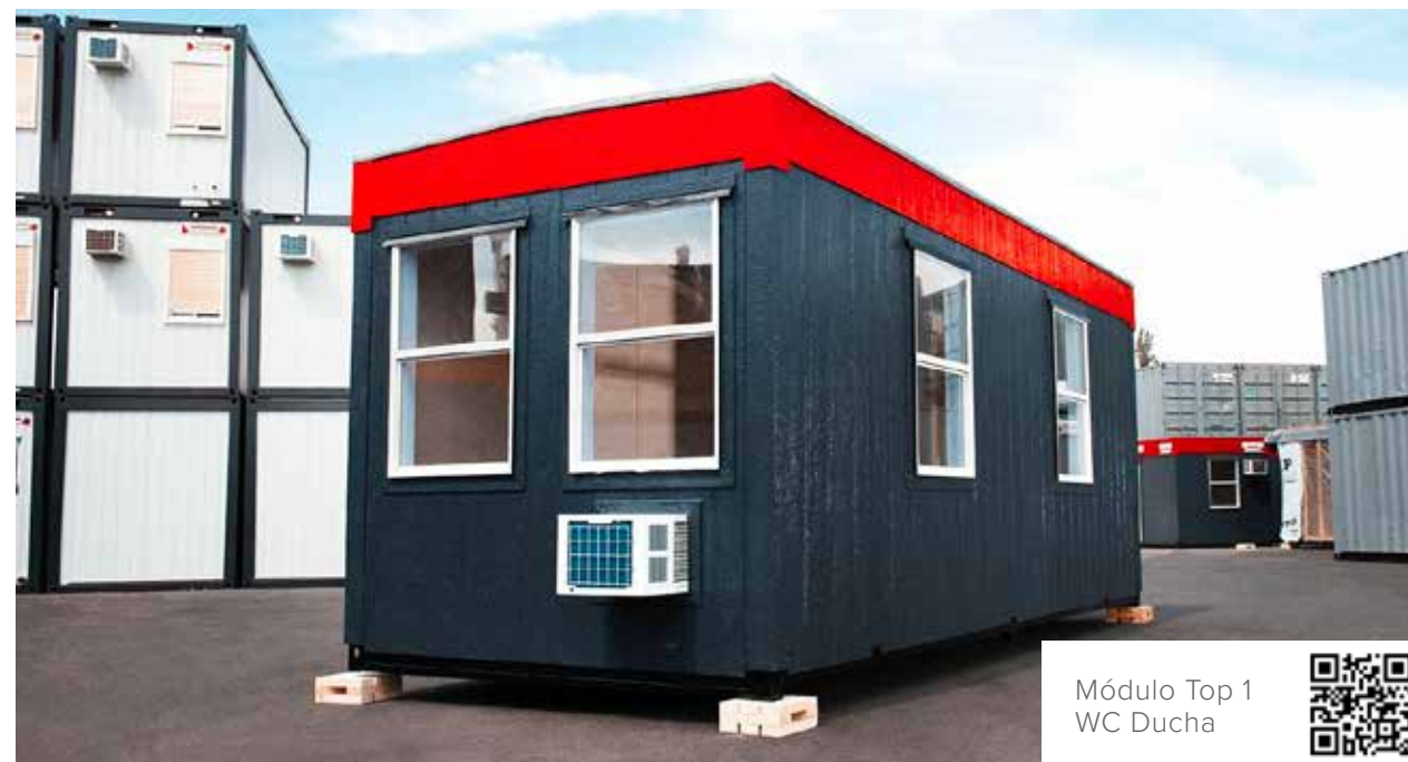
Módulo Top 1 WC Ducha