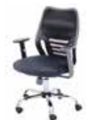
d. Silla Profesional