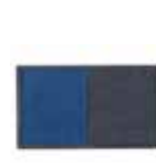
i. Limpia pies